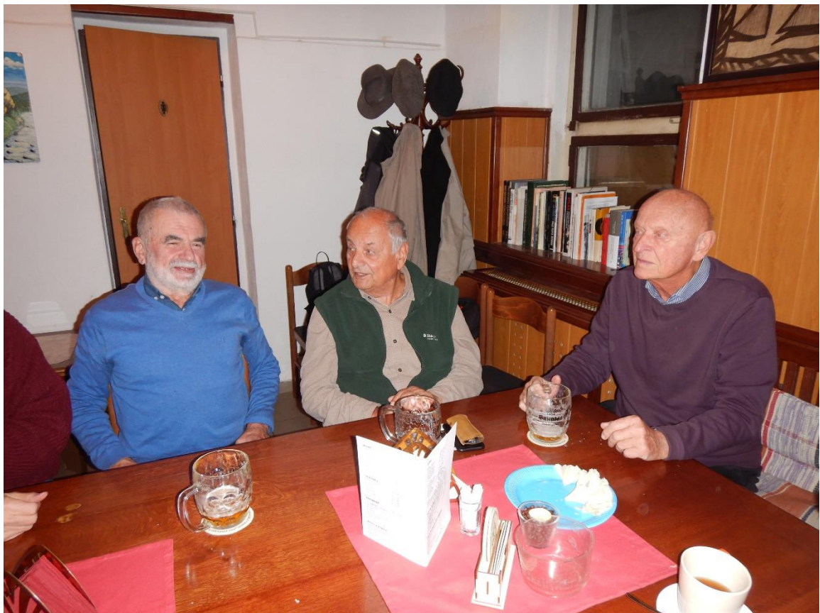
Mahdí, Pegas a Cancidlo