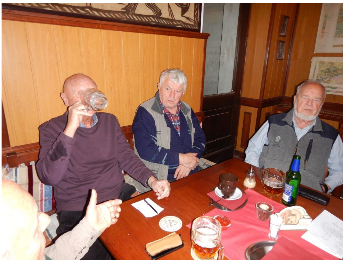
Pak ještě přišel Pirilík , a i tak jsme se vešli kolem stolu bez potíží